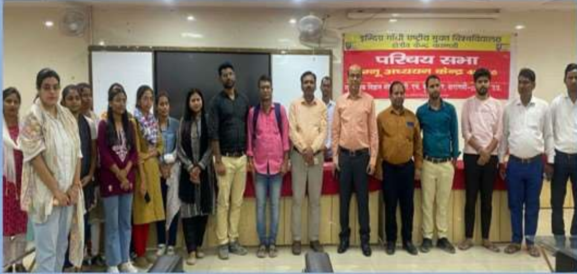
Induction meeting at IGNOU LSC(R) 2709, DDU Gorakhpur on 19.04.2024