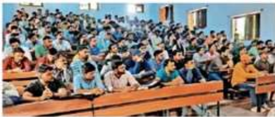
अध्ययन केंद्र के अंतर्गत इग्नू अध्ययन केंद्र के उद्घाटन कार्यक्रम में उपस्थित छात्रों की शक्ति