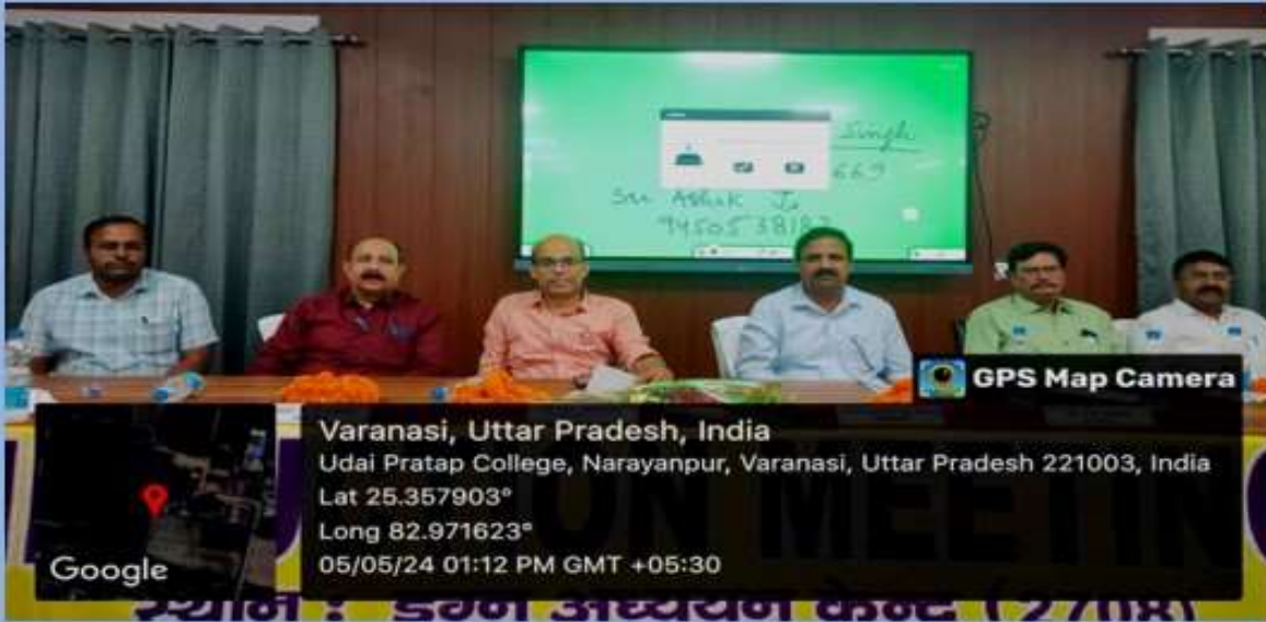
Induction meeting at IGNOU LSC(R) 2708, U.P College, Varanasi on 05.05.2024