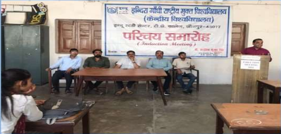
Induction meeting at IGNOU LSC(R) 48017 T D College, Jaunpur on 05.05.2024